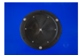
Deschidere pentru introducerea sticlelor (standard Ø 160 mm, dimensiune specială Ø 190 mm)

EUROPLAST ROMANIA SRL 410169 Oradea/ Bihor/ Romania