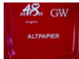
Ștanțare la cald