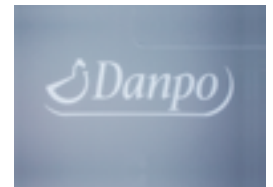
Ștanțare la cald și numerotare